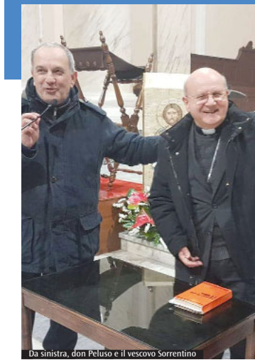
Da sinistra, don Peluso e il vescovo Sorrentino

brazione Eucaristica interamente dai nostri ragazzi. Al di là dell'aspetto puramente vocale o musicale, organizzare il coro ci ha permesso di stare di più insieme e ha permesso ai ragazzi, di età diverse, di conoscersi meglio. Nel gruppo c'erano addirittura bimbi che non sanno ancora leggere ed il loro impegno è stato ancor più grande da apprezzare perché non solo sono stati esercitati a casa con i loro genitori cercando di imparare i canti a memoria, ma sono riusciti anche a prestare la giusta attenzione alle celebrazioni eucaristiche. Vederli tutti insieme, nel 6 gennaio, con quei capelli rossi, gioiosi e soddisfatti per quanto fatto, ha reso la comunità senz'altro orgogliosa. I bambini di Roccarainola, al Signore per la tanta bellezza chiamata a servire.