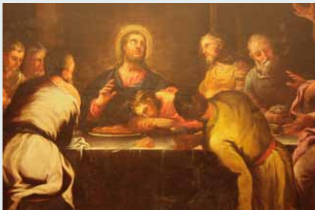
GIUSEPPE SIMONELLI? [Napoli, documentato tra il 1686 e il 1708]). Ultima Cena , ultimo decennio del Seicento / primo decennio del Settecento circa. Nola, Complesso monastico di Santa Chiara.